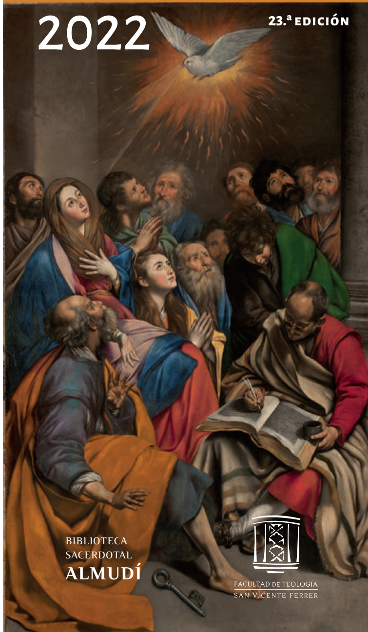
IMAGEN: PENTECOSTÉS, DE JUAN BAUTISTA MAÍNO (1612.-1614). ÓLEO SOBRE LIENZO.